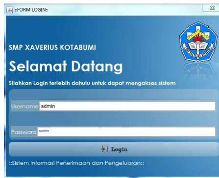
gambar 1 Tampilan Form Login