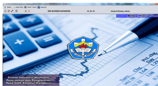
Gambar 2 Tampilan Form Menu Utama