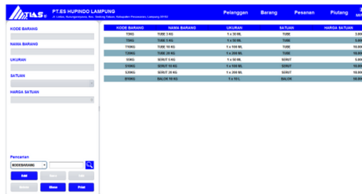
Gambar 3 Tampilan Interface Form Data Barang