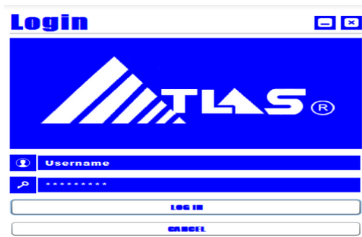
Gambar 1 Tampilan Halaman login