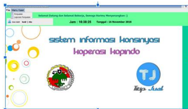
Gambar 2 Tampilan Menu Kasir