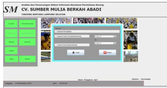
Gambar 4 Tampilan Form Cetak Laporan