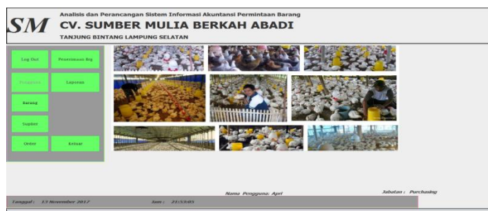
Gambar 2 Tampilan Menu Utama