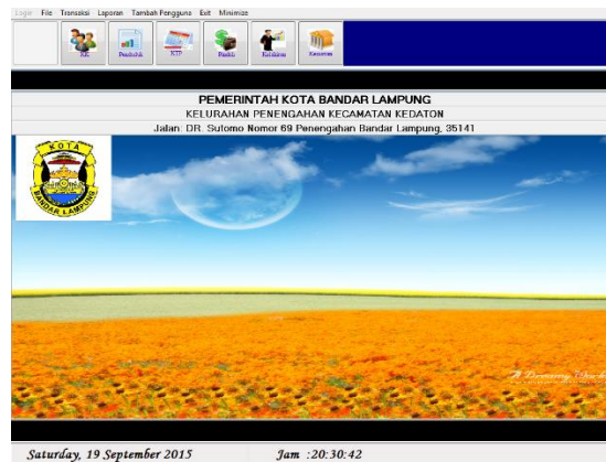
Gambar 4 Tampilan Utama