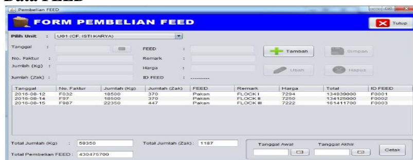
Gambar 4. Form Input Data FEED