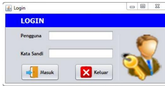
Gambar 1. Form Login Admin